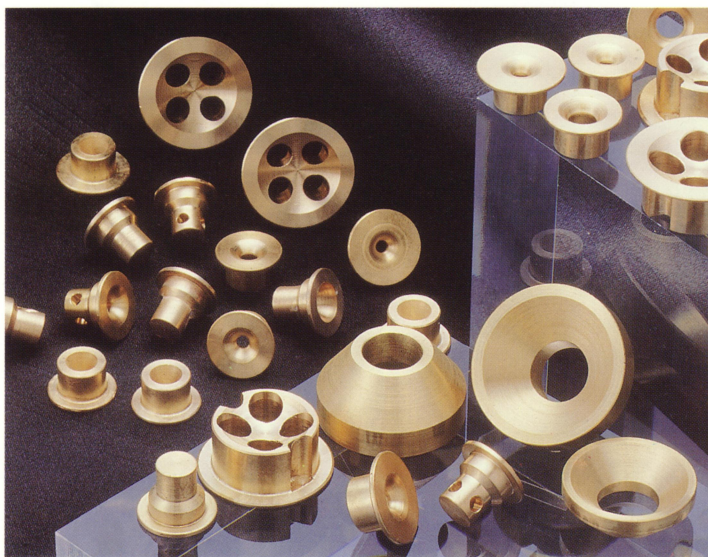
▲材質は鉛レス対応の特殊砲金製(AQ-30)で一般の給水器具と材質が同じため水質の変化・磨耗の心配もなく半永久的に使用できメンテナンスも不要です。

施工後は今までどおりに水を使用していただけます。以前と変わらない水の使用感にもかかわらずエコバルブによって水量がコントロールされている為、確実に節水され「水資源の節約」「水道料金の節約」に効果を発揮します。